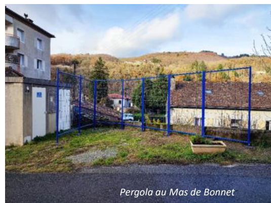
Pergola au Mas de Bonnet