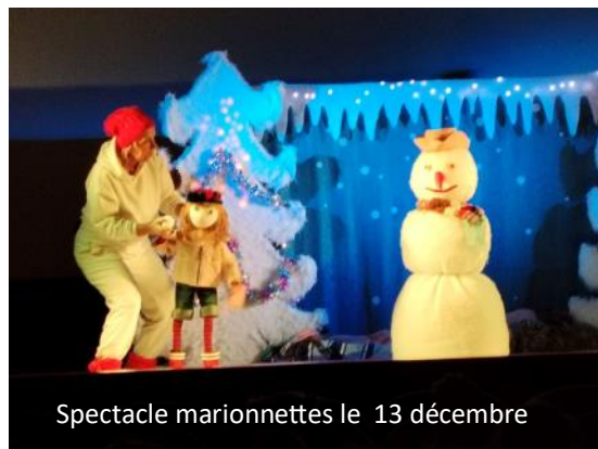
Spectacle marionnettes le 13 décembre

En attendant les beaux jours, nous vous rappelons que Cinecran81 organise 2 projections par mois au cinéma Jacques Brel. Après «Les Trolls 3» ou encore «Second tour» en décembre, ce sera au tour de «L'Abbé Pierre : une vie de combat» le vendredi 12 janvier et de «Monsieur le Maire» le 26 du mois de janvier. Les enfants pourront, à nouveau, inviter leurs parents au cinéma lors d'une séance le vendredi 9 février à 18h30 avec le film d'animation Disney «Wish, Asha et la bonne étoile». Le carnaval aura lieu cette année le 6 avril, réservez la date !